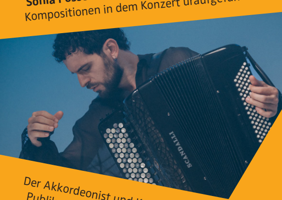
Der Akkordeonist und Komponist Pietro Roffi präsentiert dem Publikum sein preisgekröntes Werk »Quasi un Tango« selbst.