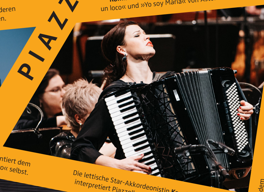
Die lettische Star-Akkordeonistin Ksenija Sidorova interpretiert Piazzollas berühmtes Konzert »Aconcagua«.